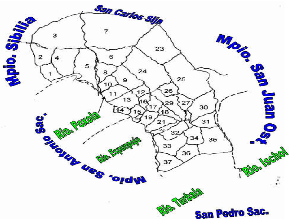
ANEXO B Cuadro: Información Demográfica del Municipio de Palestina de Los Altos, Departamento de Quetzaltenango.